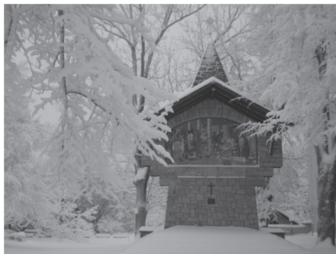
předvánoční nálada na Hostýně